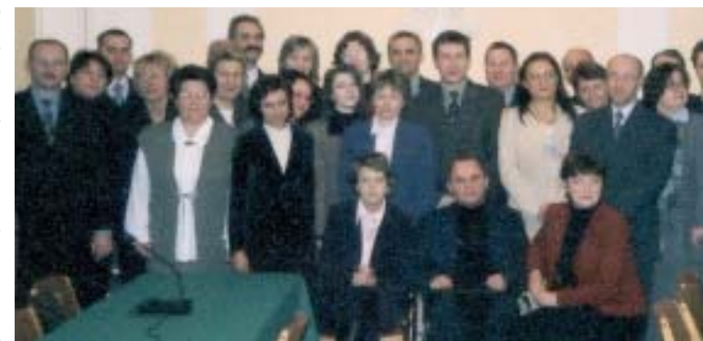
Uczestnicy uroczystości wręczenia certyfikatów dla trenerów KOSzEFS

wienie przykładów projektów dotyczących konkretnych grup i problemów np. kobiet, osób niepełnosprawnych, przedsiębiorców czy rejonów wiejskich. Szkolenia w ocenie uczestników. W 2003 roku KOSzEFS przeprowadził 102 szkolenia na terenie całego kraju, w których przeszkolonych zostało 2739 osób. Każde szkolenie było oceniane przez uczestników. Większość z nich oceniła szkolenia wysoko. Z analizy ocen wynika, że szkolenia spełniły swój cel zarówno pod względem przydatności, jak i zakresu tematycznego. Szkolenia dla uczestników były nie tylko możliwością zdobycia wiedzy z za-