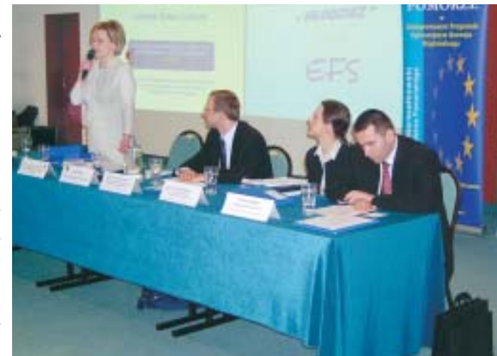
Konferencja w Gdyni

Każda z konferencji miała temat przewodni: 1. w Krakowie, 9.03.2004 Przedsiębiorczość, 2. w Poznaniu, 11.03.2004 Wykluczenie społeczne, 3. w Gdyni, 15.03.2004 Młodzież, 4. w Lublinie, 18.03.2004 Edukacja, 5. w Warszawie, 23.03.2004 Instytucje rynku pracy. Konferencje miały na celu zapoznanie uczestników z działaniami w danym obszarze, finansowanymi w ramach Sektorowego Programu Operacyjnego Rozwój Zasobów Ludzkich, Zintegrowanego Programu Operacyjnego Rozwoju Regionalnego oraz Inicjatywy Wspólnotowej EQUAL. Przedstawione zostały również najważniejsze nurty i aspekty polityki krajowej związane z tematem danej konferencji.