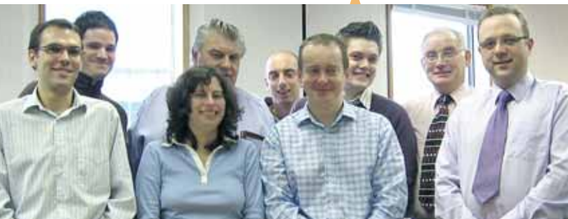
Zespół ds. Badań, Monitoringu i Ewaluacji w Welsh European Funding Office (WEFO)

Spośród 7 badań wykonanych przez RME warto zwrócić uwagę na ewaluację uaktualniającą Programu dla wschodniej Walii realizowanego w ramach Celu 3 ( Mid-term Evaluation Update for the East Wales Objective 3 Programme ) i współfinansowanego ze środków Europejskiego Funduszu Społecznego (EFS). Badanie zlecono zewnętrznemu wykonawcy – konsorcjum składającemu się z firm Old Bell 3 i CRG Research Ltd. oraz Uniwersytetu w Cardiff.